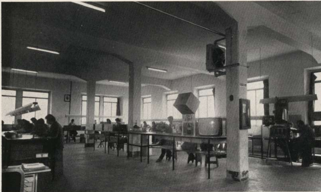
Carbonari: industriale moderno nell'Umbria antica